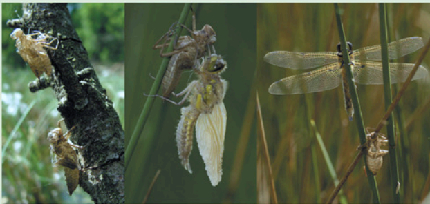
Van larve naar echte libel